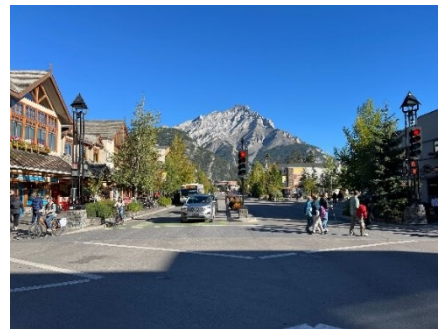
左：バンフでのオーロラの景色 右：バンフのダウンタウンの様子