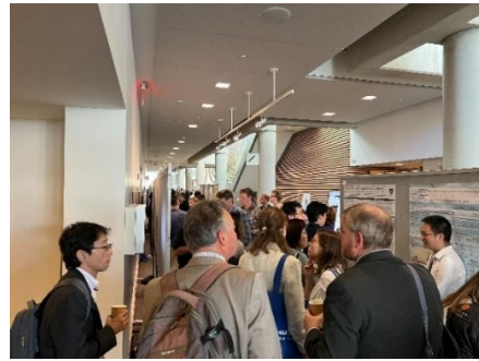
ポスター発表での様子